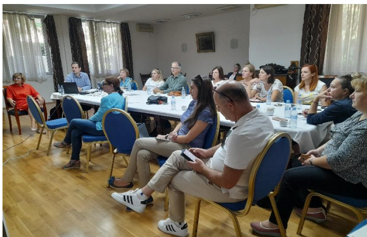
Фотографија: Работилница за користење и одржување на дигиталниот регистар на НРК

Како резултат на оваа мисија се изработија и два вебинари и упатства за користење и одржување на дигиталниот регистар на НРК.