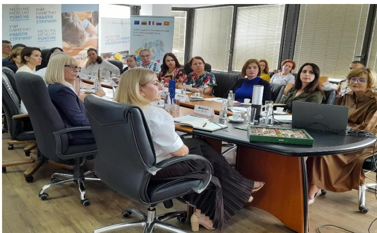
Фотографија: Осми состанок на Управниот одбор на проектот одржан на 19 септември

Во пресрет на завршувањето на проектот, последниот плански период предвидува 29 мисии што треба да ги реализираат експерти од земјите членки, распоредени во рамките на седум проектни активности. Покрај тоа ќе биде организиран и настан за затворање на проектот за да се одбележи успешниот завршеток на проектот. Состанокот на Управниот одбор заврши со формално одбрување на седмиот квартален извештај и на следниот плански период.